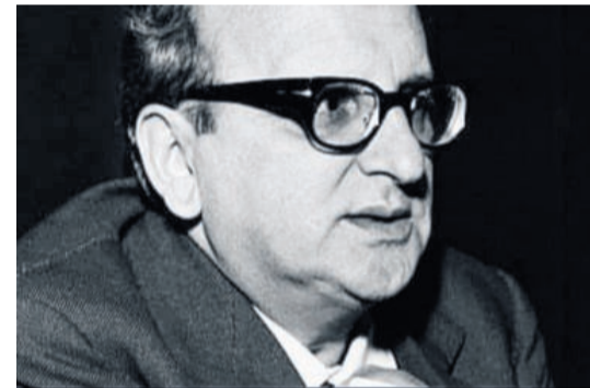
Famoso ma non ricco

pre li, a chiosare, commentare, sbuffare, con un “mah!” o un “...icché tu ffa!”. Aioli ne segue la scia, non gli si sovrappone, non suscita la reazione infastidita di Mario Monicelli ai continui primi piani di Nanni Moretti (“sei bravo, ma ora per favore spostati e lasciami guardare il film”), non si accoda alla fila dei narcisisti, ombelicali ed egoriferiti diaristi che infestano la letteratura italiana contemporanea, ponendosi a misura di tutte le cose e pretendendo di rendere universali fatti insignificanti, tranne che per i parenti stretti, delle loro biografie.