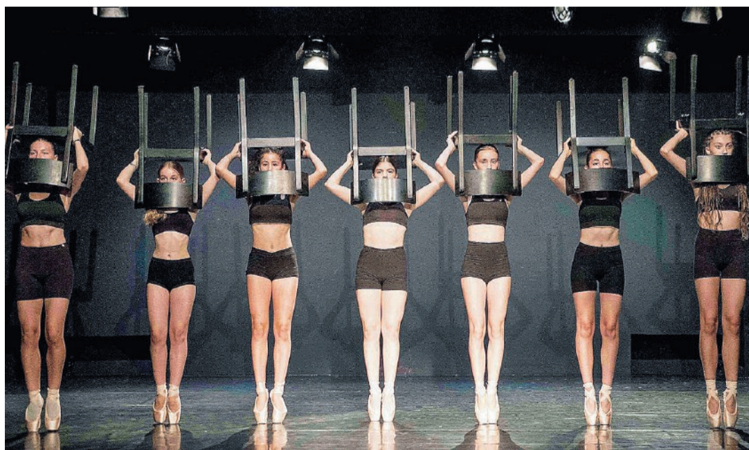
Tutte le informazioni su www.teatrosanmaterno.ch

Tra gravità e verticalità, domani e domenica ad Ascona